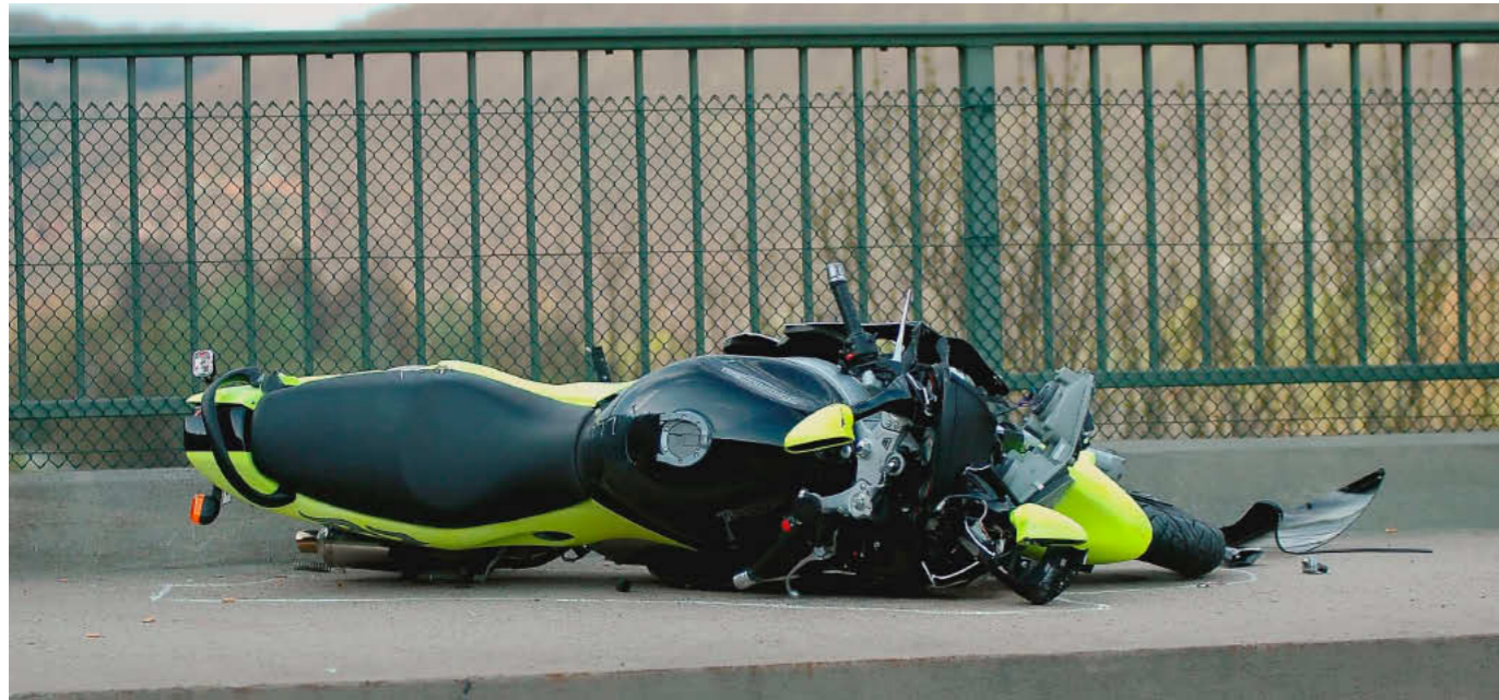
Brückensturz: Ein Motorradfahrer ist gestern in Wertheim tödlich verunglückt.

Unfall: In der Kurve beschleunigt, an die Bordsteinkante geraten und über das Geländer geschleudert