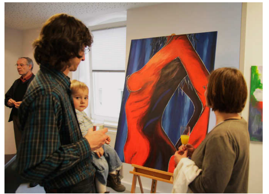
Den Weg von der Laienspielbühne in eine Ausstellung im Bettinger Bürgersaal haben diese Bilder gefunden.

WERTHEIM. Ein dramatischer Unfall mit Todesfolge ereignete sich am gestern Nachmittag um 16.30 Uhr auf der Spessartbrücke zwischen Wertheim und Kreuzwertheim: Ein 54-jähriger Motorradfahrer beschleunigte in der Kurve auf der Brückenauffahrt Richtung Kreuzwertheim seine Maschine und verlor die Kontrolle. Er überquerte die Gegenfahrbahn und geriet offensichtlich mit dem Vorderrad an die Bordsteinkante. Dabei wurde er von seinem Motorrad abgeworfen, über das Brückengeländer geschleudert und stürzte 25 Meter in die Tiefe. Er lag zwischen Radweg und Main. Die Helfer des Roten Kreuzes versuchten vergeblich fast eine Stunde das Leben des Mannes aus dem Main-Kinzig-Kreis zu retten. Der Mann war mit einer Gruppe von insgesamt sieben Motorradfreunden unterwegs, die das schlimme Ereignis mit ansehen mussten.